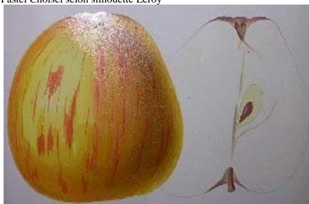
Vue Willermoz, 1863, vol.1, Pomologie de la France.

ORIGINE : Anglaise, 1729(Langley, "Pomona Britannique", 1729, pl.78, fig.6, 1vol., angleterre). Introduite en France vers 1835 et les pépinières A.Leroy d'Angers la vendaient encore en 1916 mais plus en 1935. Conservée à Brogdale (the book of apples, 1993, p.186).